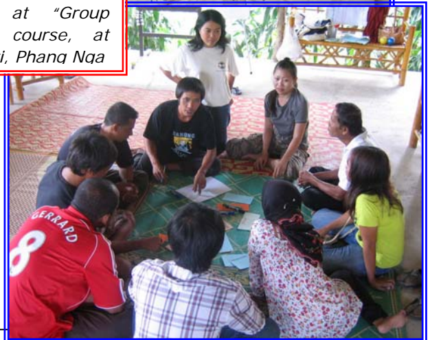
In the class room and small group exercise