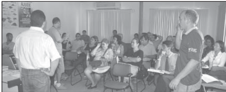
Reunião da Câmara da Costa das Baleias em Caravelas é uma aposta na regionalização do Turismo

No entanto, 2007 parece marcar uma virada de mesa no campo do turismo regional. A criação da Câmara