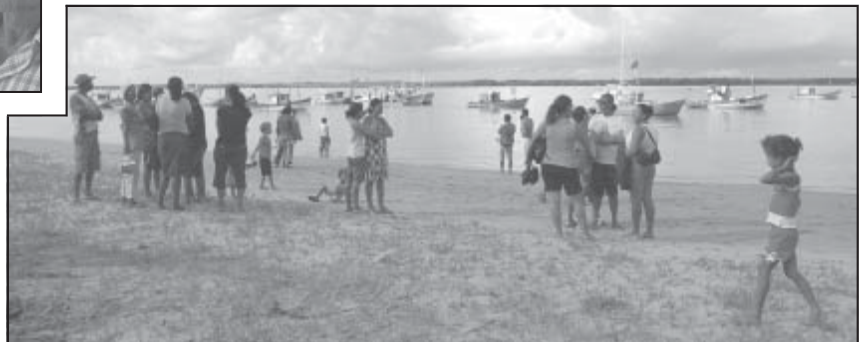
Foto acima e ao lado: Reuniões e Consultas públicas sobre a Reserva Extrativista do Cassurubá reuniram centenas de marisqueiros e pescadores de Nova Viçosa e Caravelas no Centro de Visitantes do Parque Marinho dos Abrolhos.

Na foto, mais abaixo: Grupo de pescadores conversando com moradores da região ribeirinha sobre a importância da Reserva Extrativista.