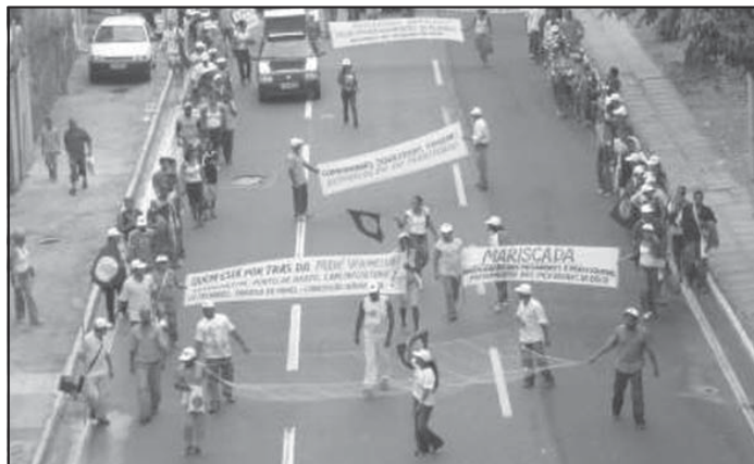
Movimento de Pescadores da Bahia organizado pelo Conselho Pastoral da Pesca (CPP) com a participação de diversas cidades da Bahia, como Caravelas, Canudos, Corumbau, Porto Seguro, ribeirinhos do São Francisco fizeram uma passeata pelas ruas de Salvador até a sede da Bahia-Pesca. Entre as reivindicações estavam a criação de políticas públicas voltadas para o pescador artesanal: criação de unidades de beneficiamento de pescado, linhas de investimento para extrativistas, assistência técnica. Defenderam também um basta na implantação de fazendas de Camarão na Bahia e um Não à transposição do Rio São Francisco.